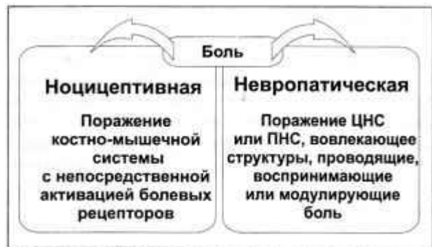
Рисунок 3. Терминология болевых синдромов в неврологии