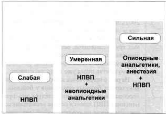
Рисунок 5. Группы препаратов для купирования боли различной интенсивности