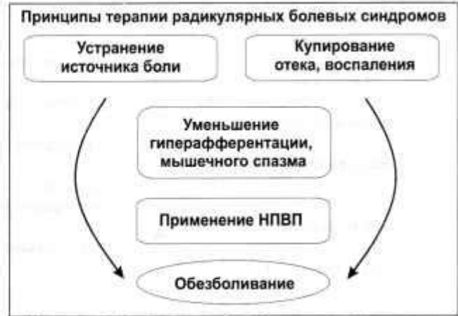
Рисунок 6. Алгоритм обезболивающей терапии при радикулярных синдромах