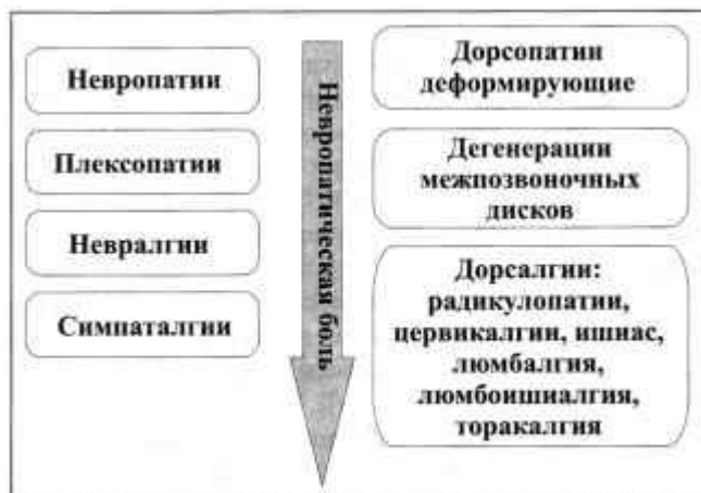
Рисунок 4. Невропатические болевые синдромы