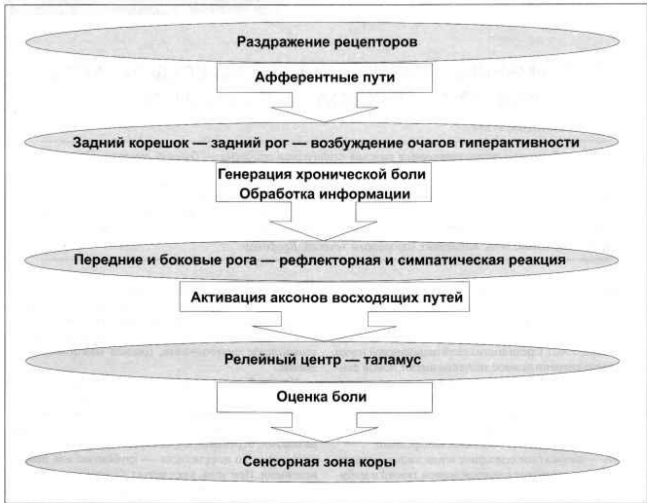
Рисунок 1. Пути проведения боли